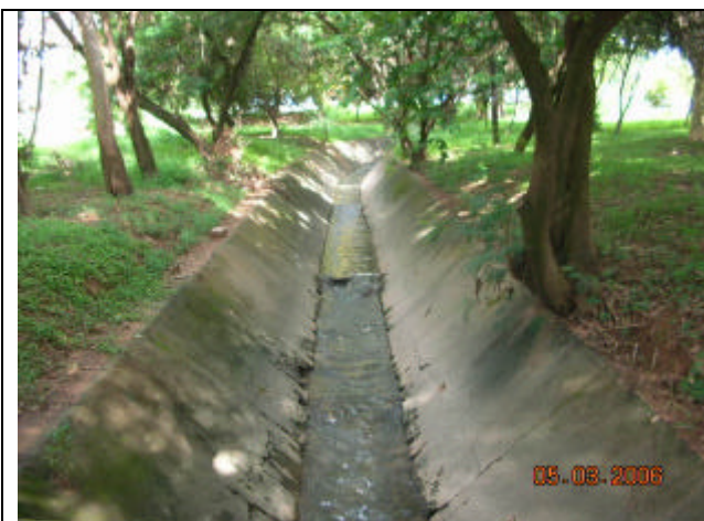
Deságüe do Córrego de Drenagem Santa Marcelina