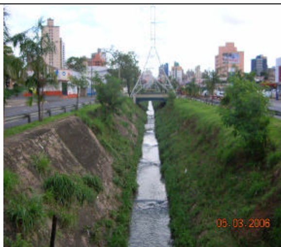
Avenida Orozimbo Maia, em 2006