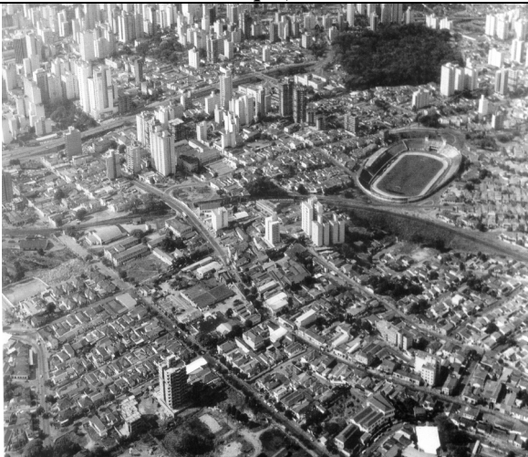
Vista do Bairro Bosque em 1988