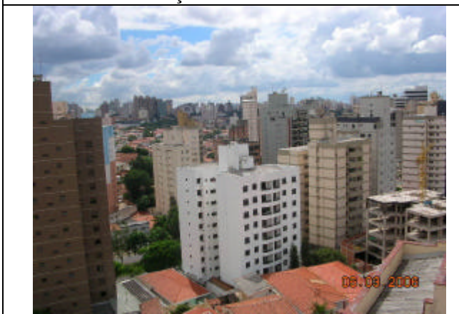
Centro – Região de grande Verticalização