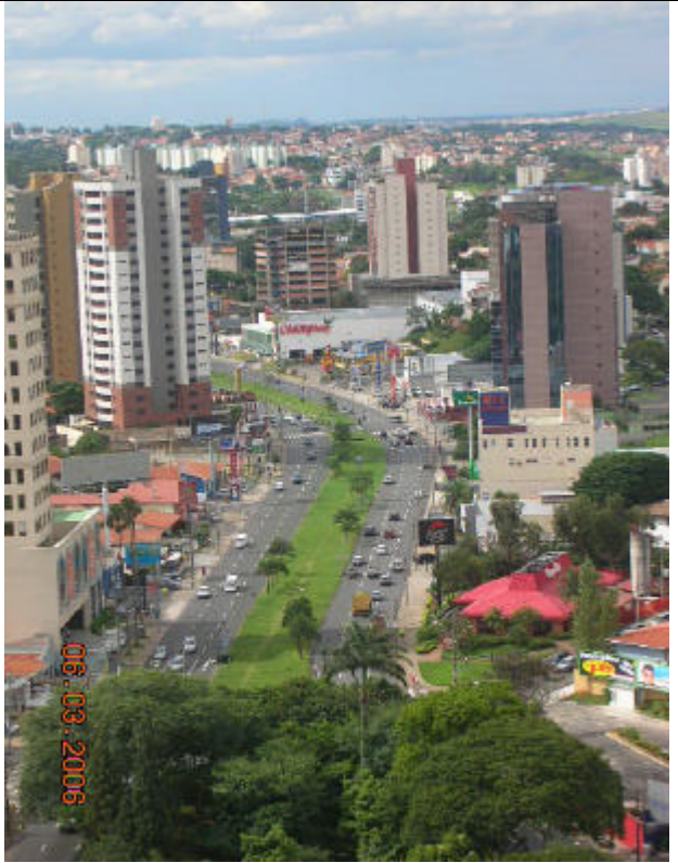
Vista Aérea da Av. Norte-Sul