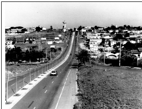
Rodovia Heitor Penteado em 1988