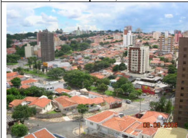
Jd. Proença e Av. Princesa d'Oeste