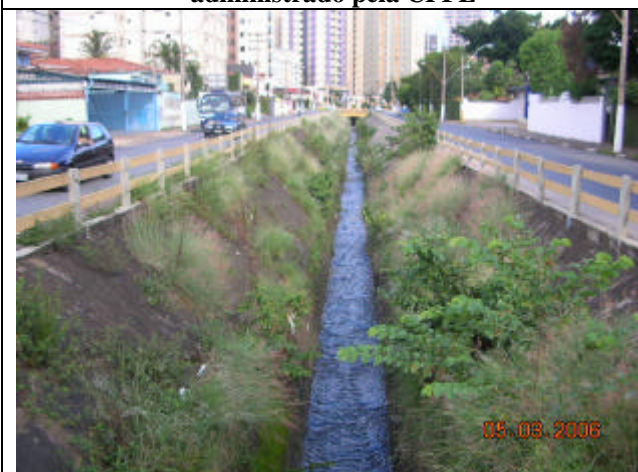
Trecho não canalizado, na Av Anchieta, próximo ao deságüe na Av. Orozimbo Maia