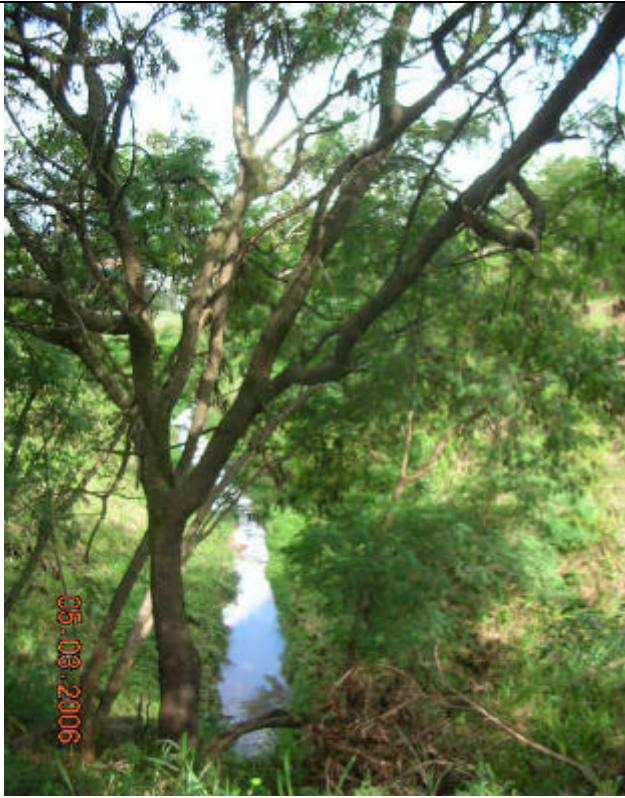
Visão à montante do Córrego do Mato Dentro