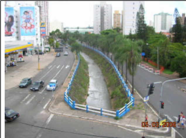
Córrego Proença (trecho da Av. Princesa d'Oeste)