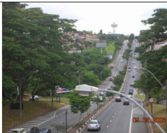
Rodovia Heitor Penteado em 2006