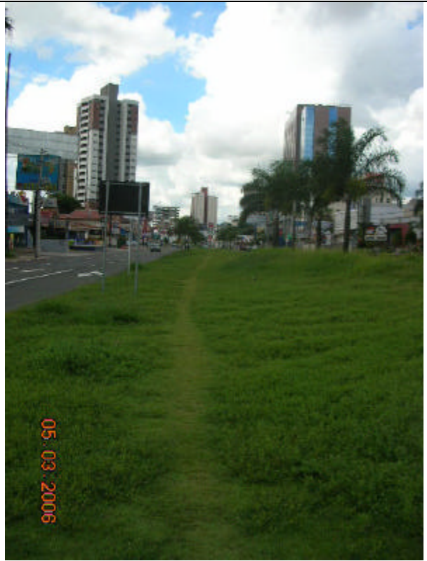
Vista da área canalizada do Córrego Proença