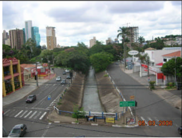
Córrego Proença (trecho da Av. Norte-Sul)