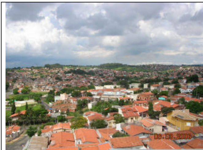
S. Fernando, Jd. Parapanema, Vila Orozimbo Maia