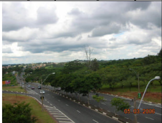
Vista de Parte do Parque Ecológico Monsenhor José Salim (à direita)