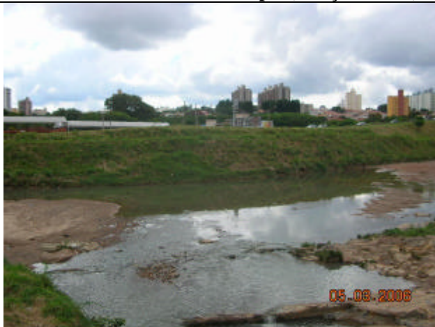
Formação do Anhumas: A direita o Córrego Proença e à esquerda o Córrego da Av. Orozimbo Maia