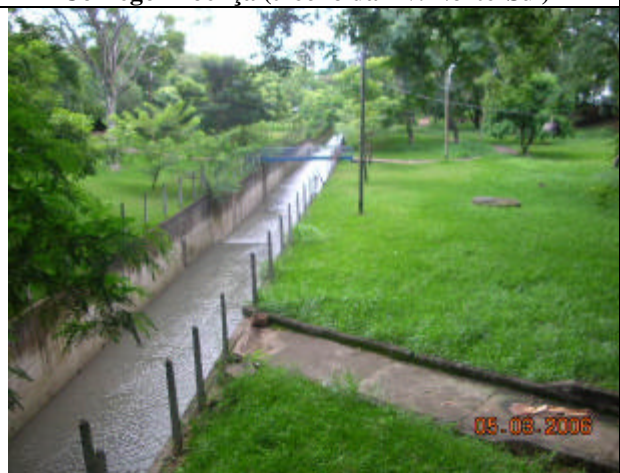
Córrego Proença com as margens não ocupadas