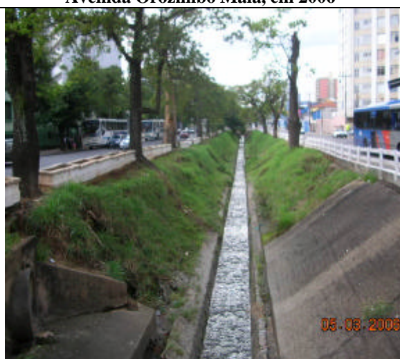
Vista térrea da Av. Orozimbo Maia, 2006