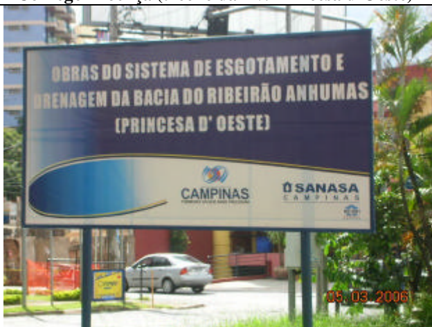
Placa do Poder Publico Municipal (Março de 2006)