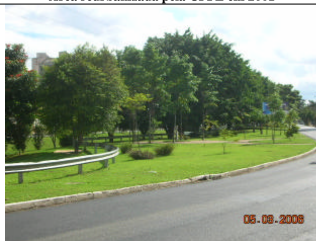
Trecho da área reurbanizada pela CPFL na Av. Orozimbo Maia, em 2001