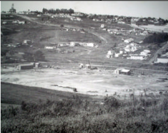
Vista do Jardim Guarani, em 1950