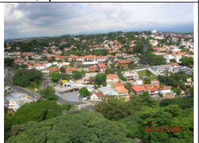
Bairro horizontal e residencial 'Nova Campinas'