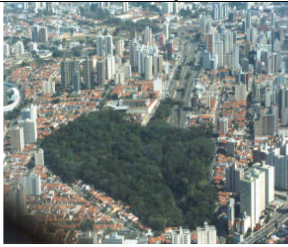
Vista do Bosque dos Jequitibás, em 2003