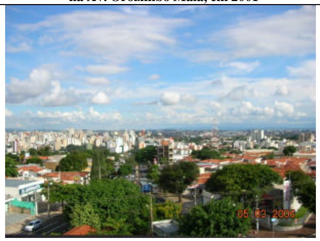
Vista do Alto Anhumas, do ponto culminante da Bacia. Torre do Castelo