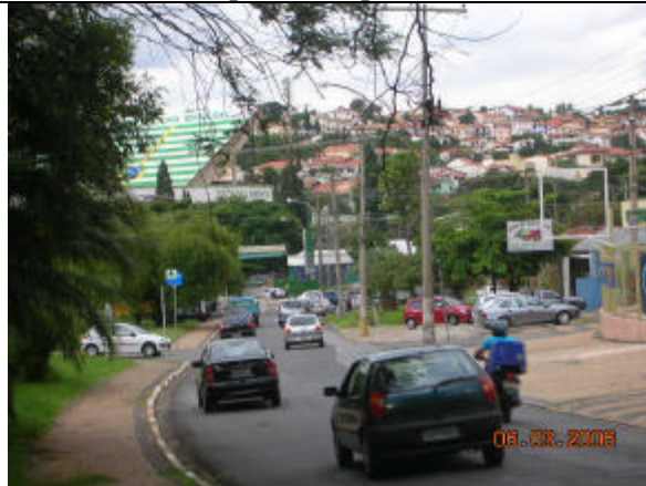
Vista do Jardim Guarani, em 2006