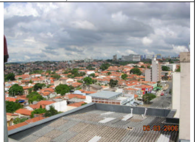
Swift, Hipermercado Extra e Faculdade UNIP