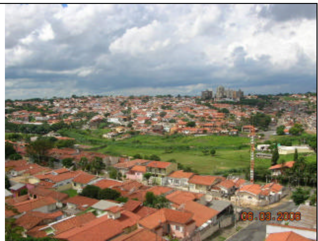
Jd. Das Paineiras, Jd. Santa Marcelina e Jd. Guarani