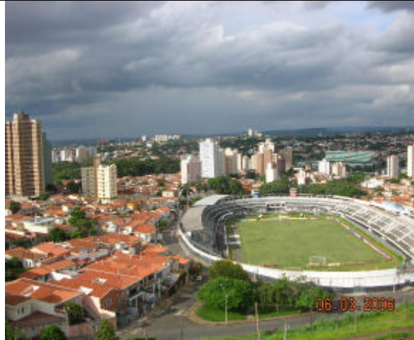
Vista do Bairro Bosque, 2006