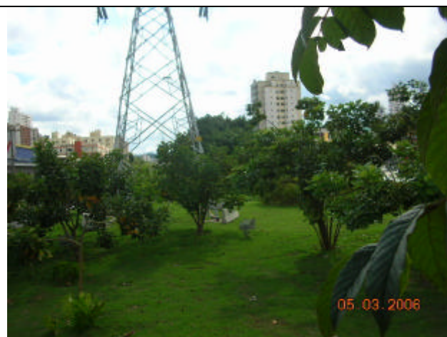
Área reurbanizada pela CPFL em 2001