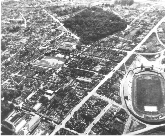
Vista do Bairro Bosque, na década de 1940