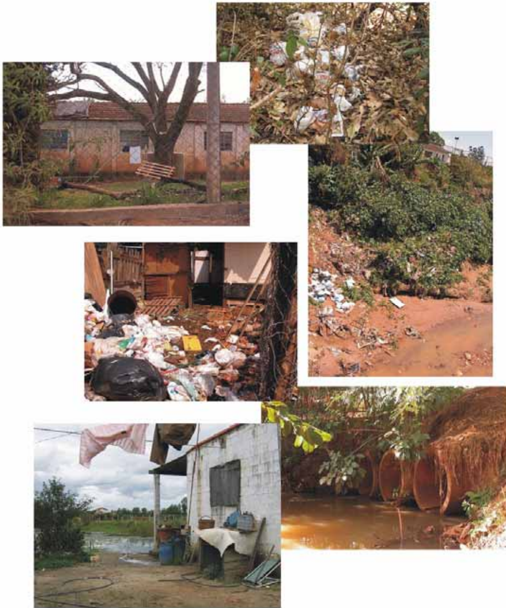
(bacia do ribeirão das Anhumas)

Reflexão: se eu quero tudo de bom para mim, as outras pessoas também desejarão coisas boas para si, e juntos podemos fazer acontecer uma vida melhor para todos.