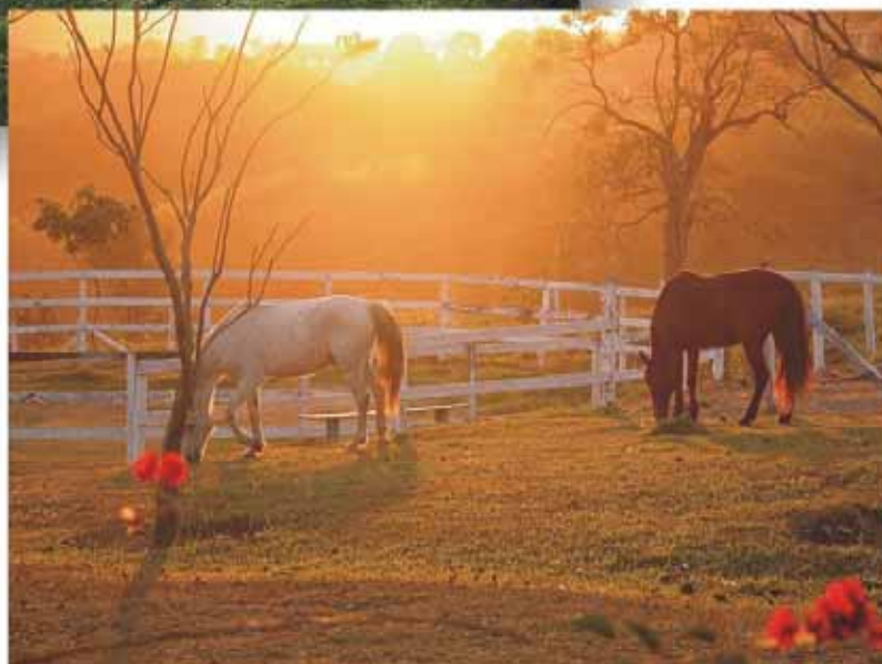
Fotografias: Vívian Furquim Scaleante (Rancho das Colinas – Souza)